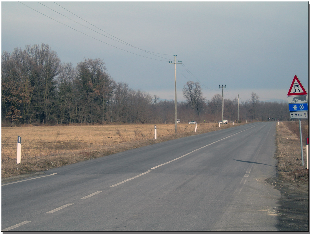
PUNTO FOTOGRAFICO 1 STATO DI ATTUALE - VISTA PANORAMICA DA VIA SANT'AGATA COMUNE DI CARPIGNANO SESIA 202 m.s.l.m. AZIMUT 170°