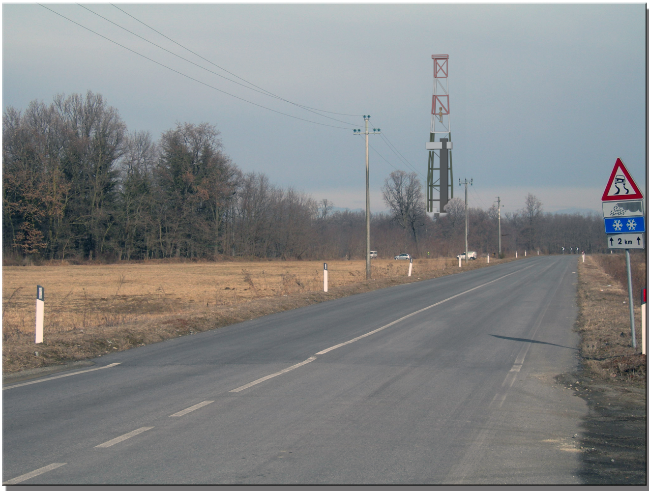
PUNTO FOTOGRAFICO 1 STATO DI PROGETTO - VISTA PANORAMICA DA VIA SANT'AGATA COMUNE DI CARPIGNANO SESIA 202 m.s.l.m. AZIMUT 170°